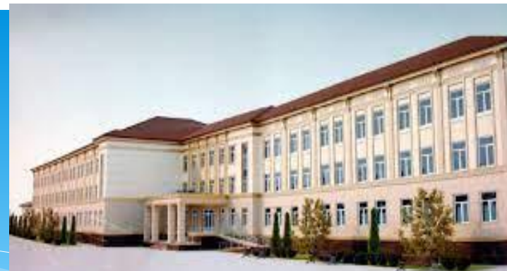
МКОУ «Ашагасталказмалярская СОШ»