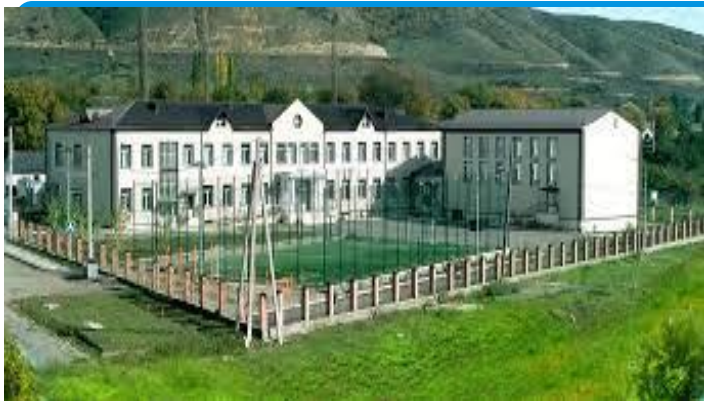
МКОУ «Алкадарская СОШ им.Г. А.Гасанова»