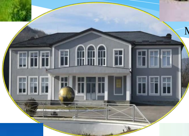
МБОУ «Цмурская СОШ»