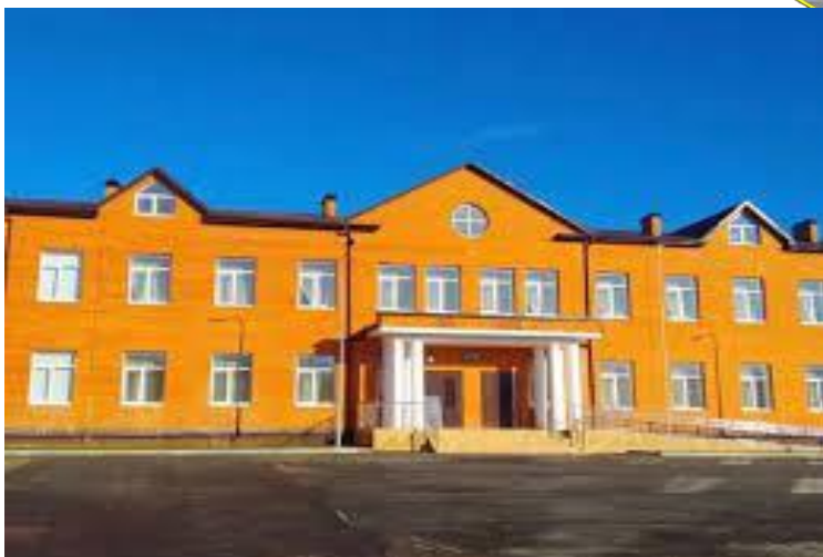
МКОУ «Касумкентская СОШ №2»