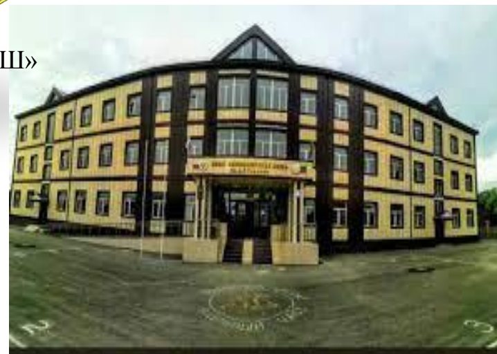
МКОУ «Эминхюрская СОШ им.А.Г.Саидова»