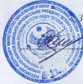
ГРАФИК ВЫДАЧИ ГОТОВЫХ БЛЮД В МКДОУ