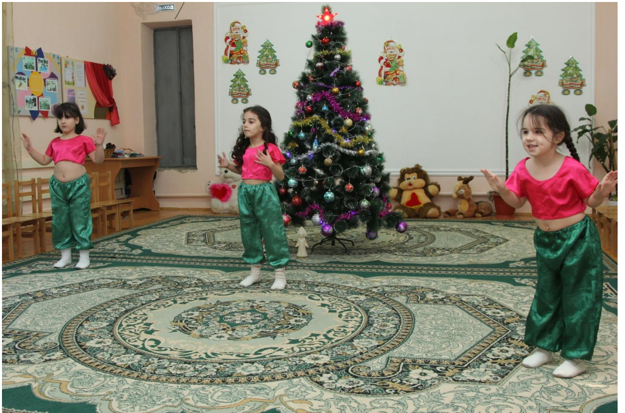
Праздник в детском саду